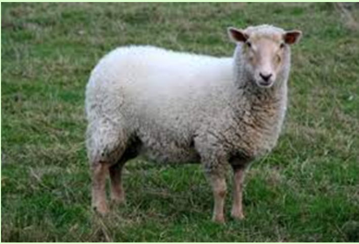
Mouton de Laeken