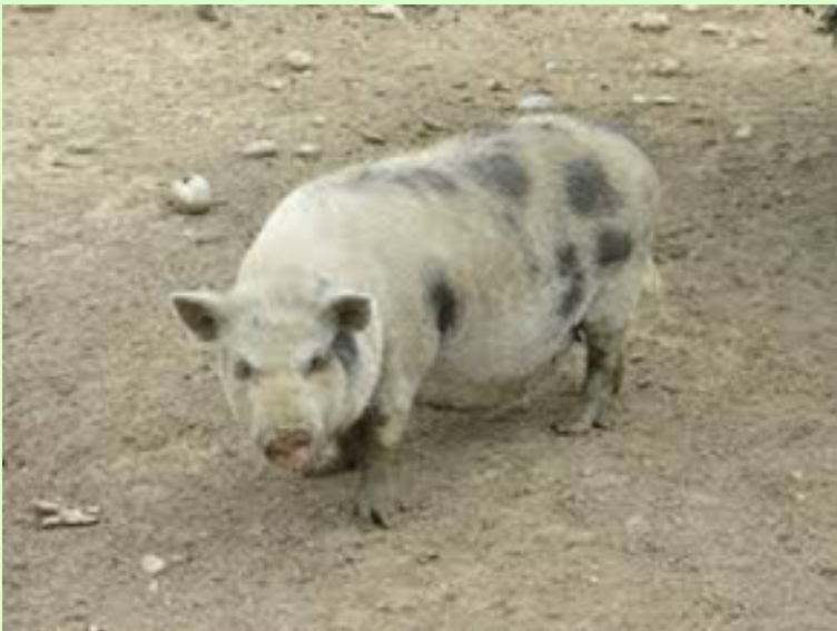
Le cochon de Gottingen